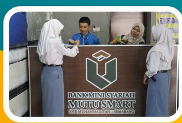
Bank Mini Syariah