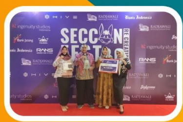
Penghargaan Film Animasi