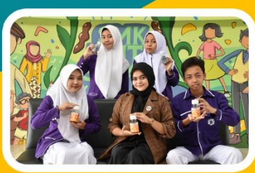
Aneka Produk Herbal